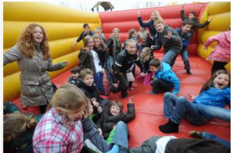
Op Noord-Beveland beschikt elk dorp over een eigen school - op de foto de kinderen van De Dubbele Punt in Geersdijk (350 inwoners). Onzeker is hoe lang dat nog kan.

Meer morgen in de PZC editie Bevelanden.