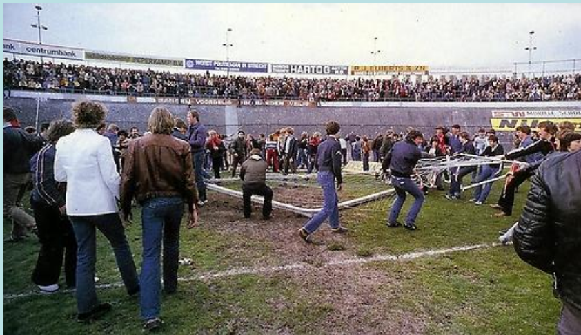
(Oud) Galgenwaard 1981